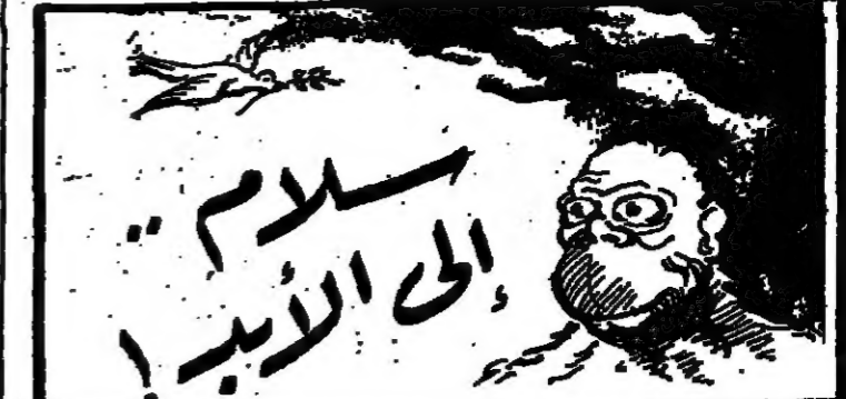
سلام إلى الأبد

دعت أحلام الشباب الملمد والنسار في شفتي مازالت كما كانت تحسن لخير وصل أجود والعين ترتشف الجمال بقطعة والقلم أصبح كاتبهاري صدى صرخ الخريف في غرامك تقدي ودعي الصبايا في غرامك تقدي للحب، وللحلام يطلبك الهوى وإذا الهوى ناداك لا ترددي فعدا سيرجرتنا الشقاء بمهارة ويفيدنا لترايه المستعبد وتسير أمواج الخليفة فوقنا من عاتق، ومخاف، ومشرد متفطرسين غلى تراب رؤوسنا لكتنتنا وهم الأبطال تشهد زحف الخريف على الشباب فيندى وهم التقاليد القديمة وأسجدي للحب، للقلب القديس، وأعصفي بالكتب، والامل الحطم جدي فالمرء في للخسين يسقط حبه ليس الفرواق استهتام أمرد من ديوانه: جناح الليل